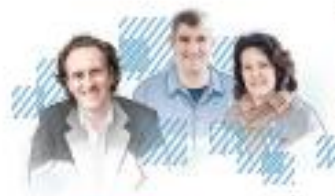
Walter Tsch & Partner

Die Ortsgenauigkeit ist ein Zeichen der Verantwortung für die Landschaft und die Umgebung. Die gesamte Anlage ist ein Zeichen der Verantwortung für die Landschaft und die Umgebung.